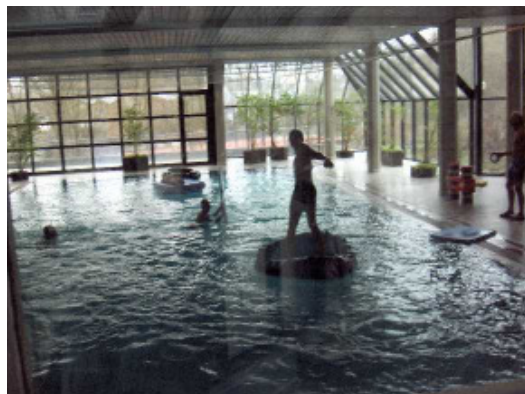
Schwimmen und Basketball