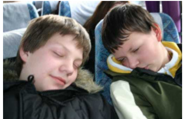
Sind wir etwa müde?