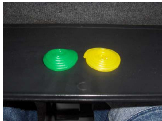
...denn bald gibt es wieder richtig gutes Essen ;-)