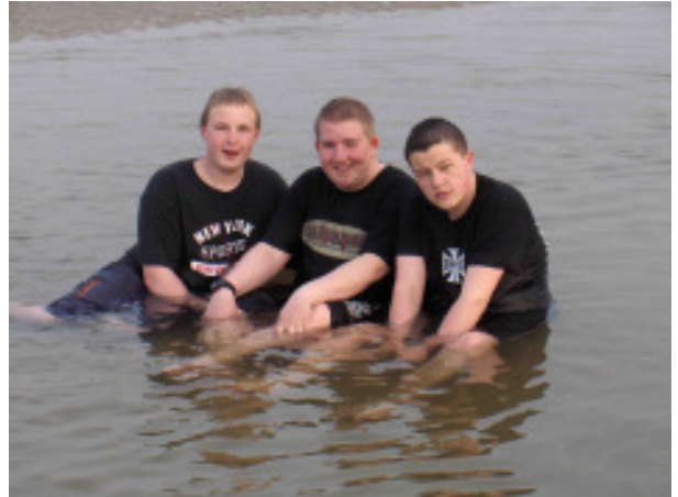
Die Seehundbänke ... (Fortsetzung folgt)

Offensichtlich hat es einigen trotz der niedrigen Wassertemperaturen doch Spaß gemacht.