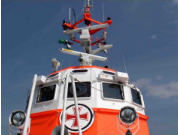
Die Brücke der „Alfried Krupp“