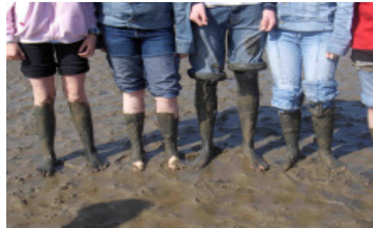
Man siehts, dass ihnen das Lachen vergangen ist, weil sie sich bis obenhin eingesaut haben. HE HE