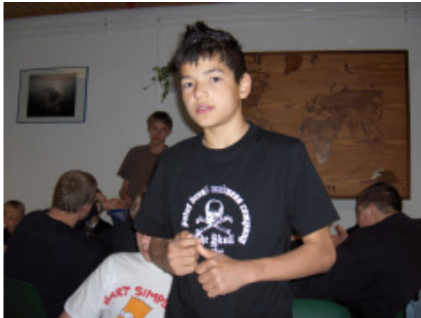
Das ist der Klassenclown der 7b. Er freut sich schon auf die Wattwanderung.