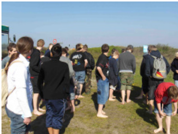
Alle freuen sich auf die Wattwanderung, aber ihnen wird das Lachen noch vergehen.