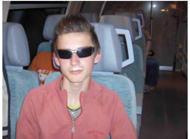
Einige Security-Mitarbeiter nahmen ihre Aufgabe so ernst, dass das Zugpersonal stellenweise den Gleisplan und die Abfahrtszeiten der Züge unseren Bedürfnissen anpasste.