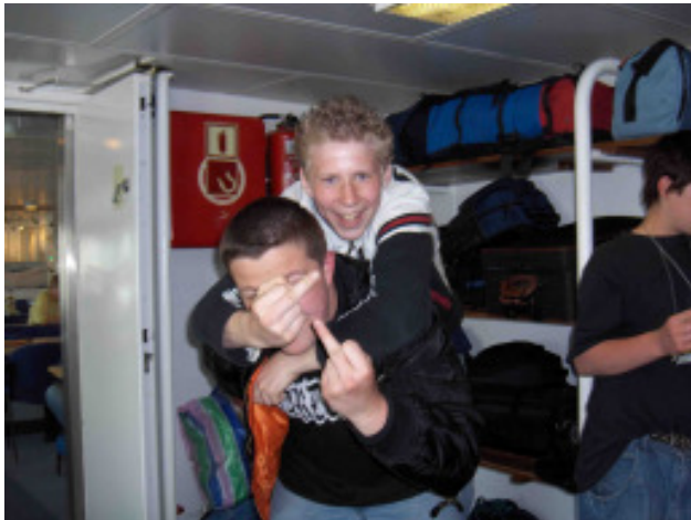
Obwohl die Schüler mit ihrem Gepäck alleine klar kommen mussten, gab es beim Umsteigen keine Probleme. Die schuleigene Security wachte über den ordnungsgemäßen Ablauf der gesamten Überfahrt.